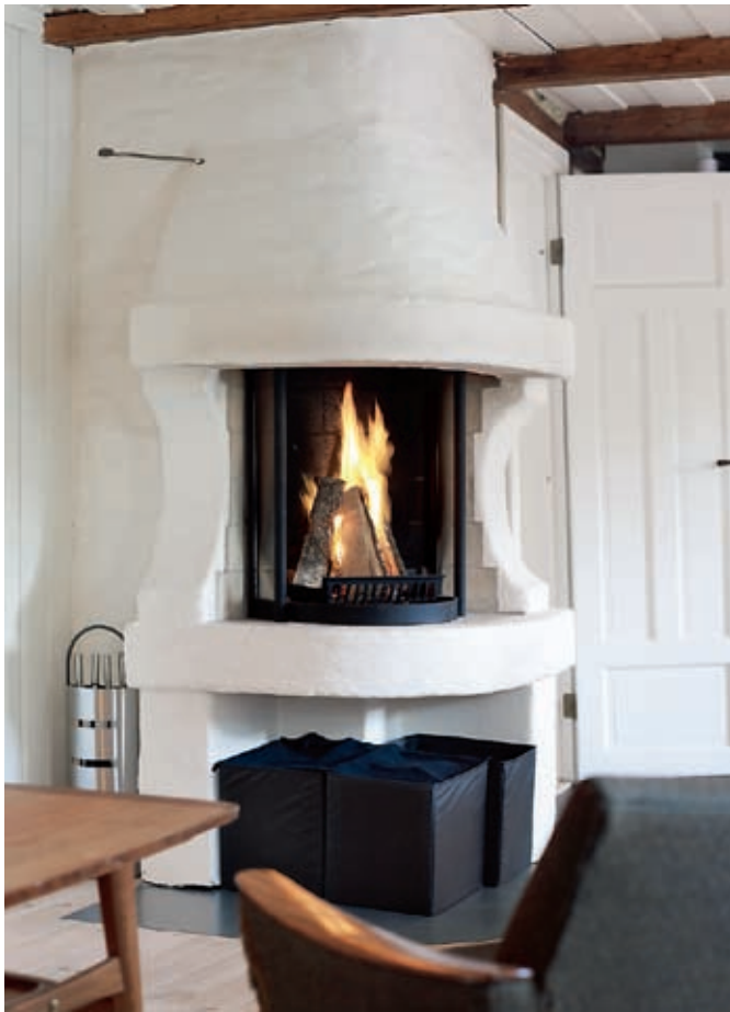
Ild i sentrum. Den nyoppførte peisen vender både mot stue og kjøkken og forsyner allrommet med lys og varme.