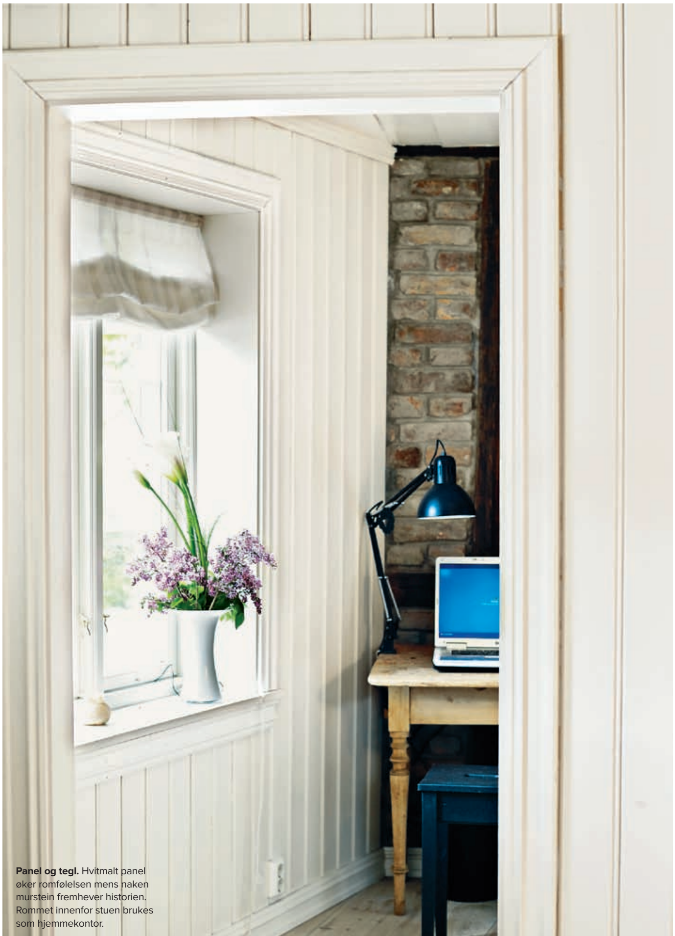
Panel og tegl. Hvitmalt panel øker romfølelsen mens naken murstein fremhever historien. Rommet innenfor stuen brukes som hjemmekontor.